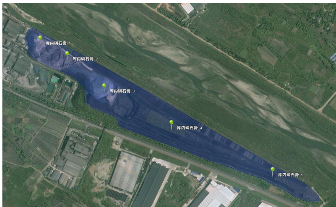
图 2 库内磷石膏采样点位布设图