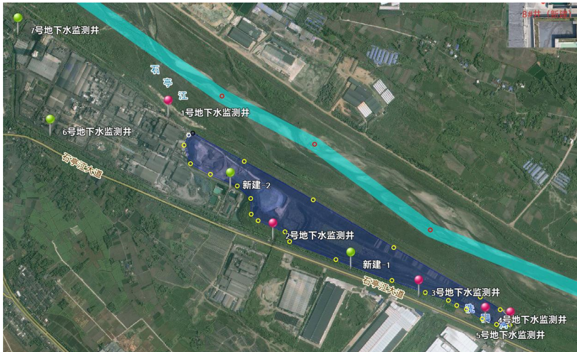
图 3 地下水监测点位布设图

目前两磷石膏库共设有 5 口地下水监测井：1#地下水监测井为上游对照井，2#、3#、4#、5#地下水监测井为污染扩散监测井。按照《磷石膏库环境风险隐患排查整治工作指南》并结合专家咨询意见，本次排查考虑新建 2 口地下水污染扩散监测井，初步位置如下。具体位置以水文地质勘察单位测量精确坐标为准，地下水采样深度应在地下水潜水水面 0.5 m 以下。