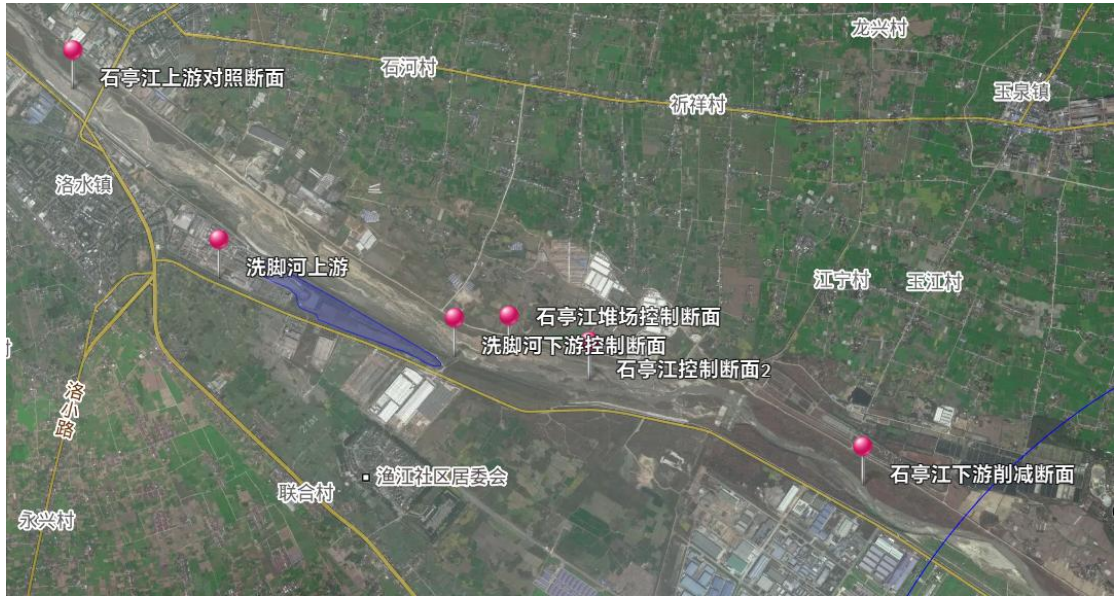
图 4 堆场地表水监测点位布设图